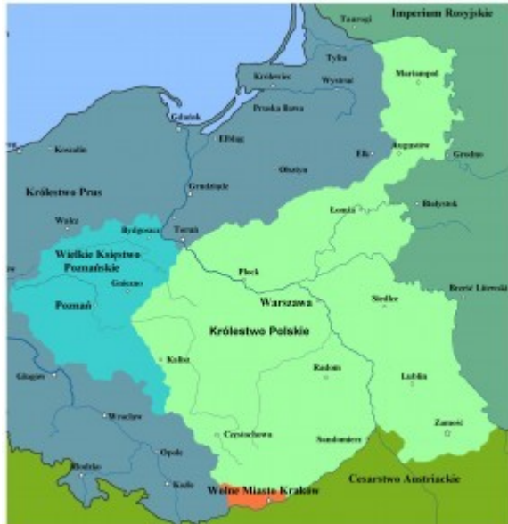
Map of Poland showing that part of the country (Congress Poland) under Russian control where the November Uprising took place